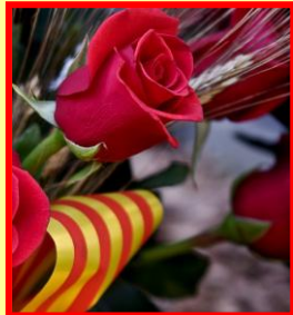
SANT JORDI 2022